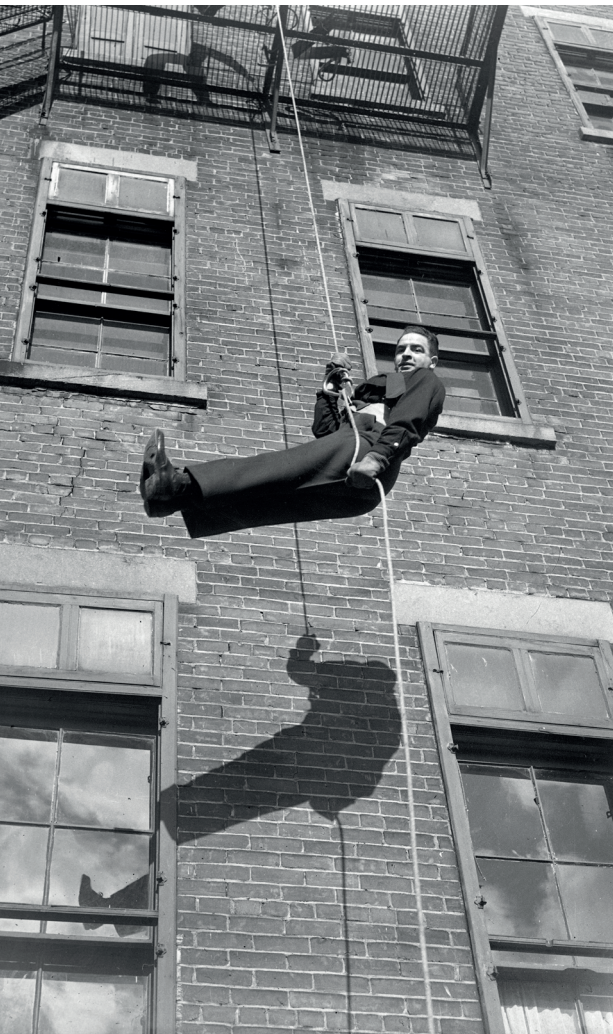
© Firemen's School PHOTO Conrad Poirier 1940 -