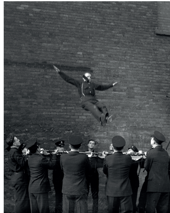
Firemen's School 1940